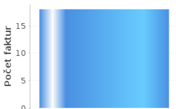
Počet vystavených faktur v měsících

● Zaplaceno po splatnosti ● Odesláno ● Po splatnosti ● Koncept