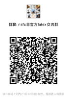
图 3. 这是图题

(提纲不做限制，请按照研究工作的自身逻辑撰写。应提炼出特色与创新点、年度研究计划)